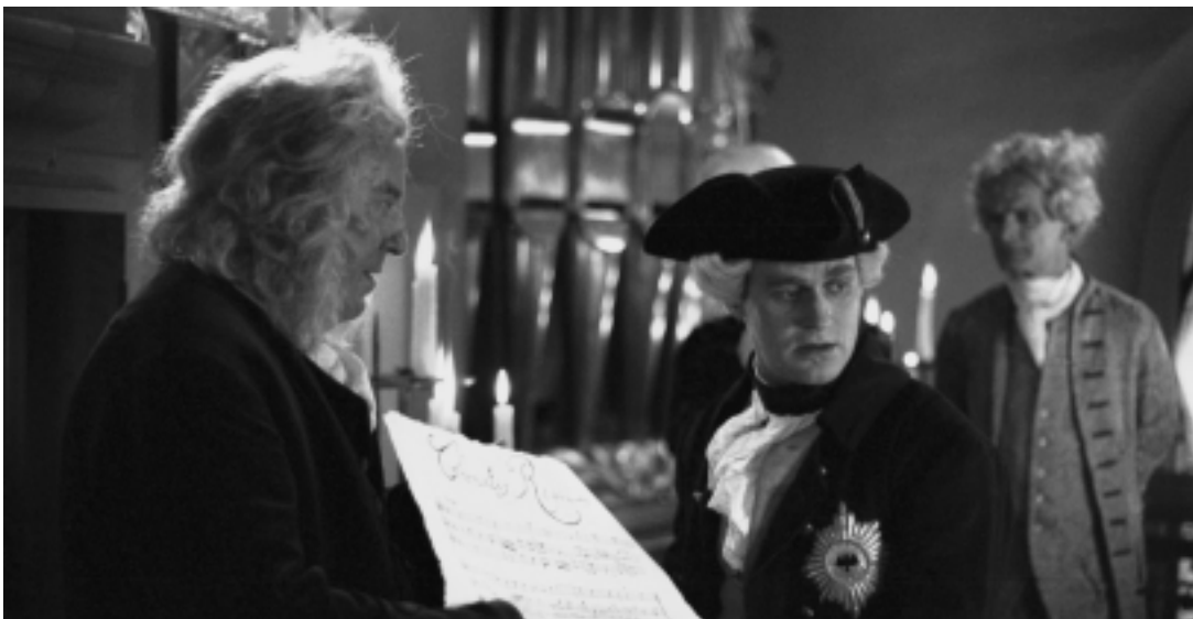
Johann Sebastian Bach und Friedrich II.

Auslöser ist das gemeinsame Musik-Erlebnis einer wilden Schlag- und Blasimprovisation, in dem beide ihren Wunsch nach Freiheit hörbar machen. Bach, so hat er es zuvor barfuß – befreit von Fußfesseln – mit Friedrich im Gras liegend geäußert, will endlich frei, unabhängig von Hof und Kirche sein. In diesem Wunsch kann ihm Friedrich folgen, denn auch er will frei sein und sich der Politik wie seines Traumas entledigen. In beidem scheitert er, während Bach mit dem Musikalischen Opfer sich seinen Wunsch erfüllt, „die Freude daran, aus fast nichts etwas zu schaffen.“ (S 27). Priorität vor seiner Rolle als Vater, sowohl in der Beziehung zu seinen Söhnen als auch in der neuen zu dem König, hat der Komponist und damit die Musik. Im Subtext des Films ist sie zentrales Thema.