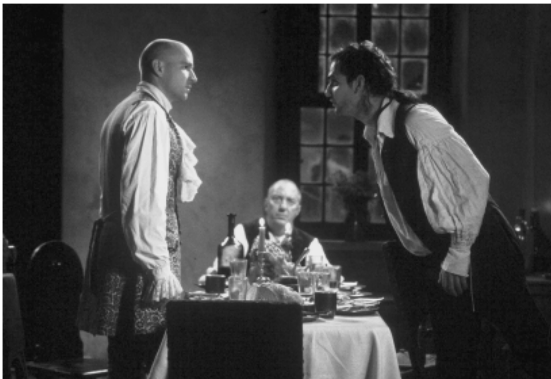
Johann Sebastian Bach zwischen seinen streitenden Söhnen Emanuel und Friedemann