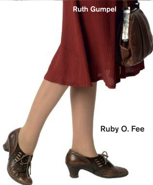
Ruby O. Fee