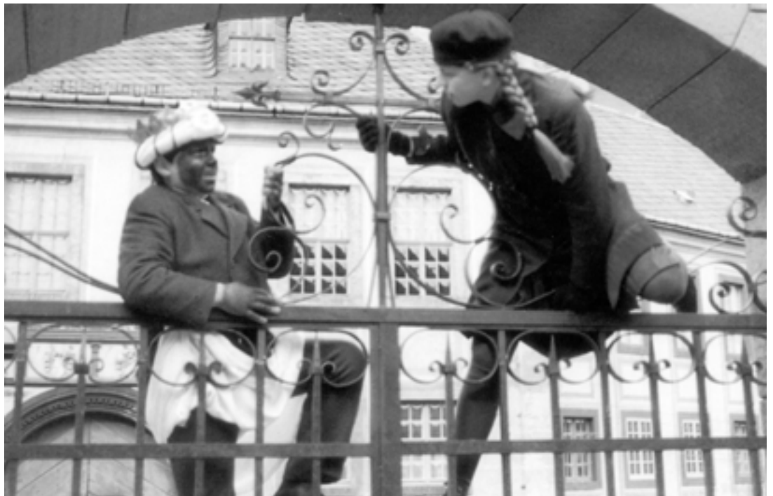
Flucht in die Freiheit