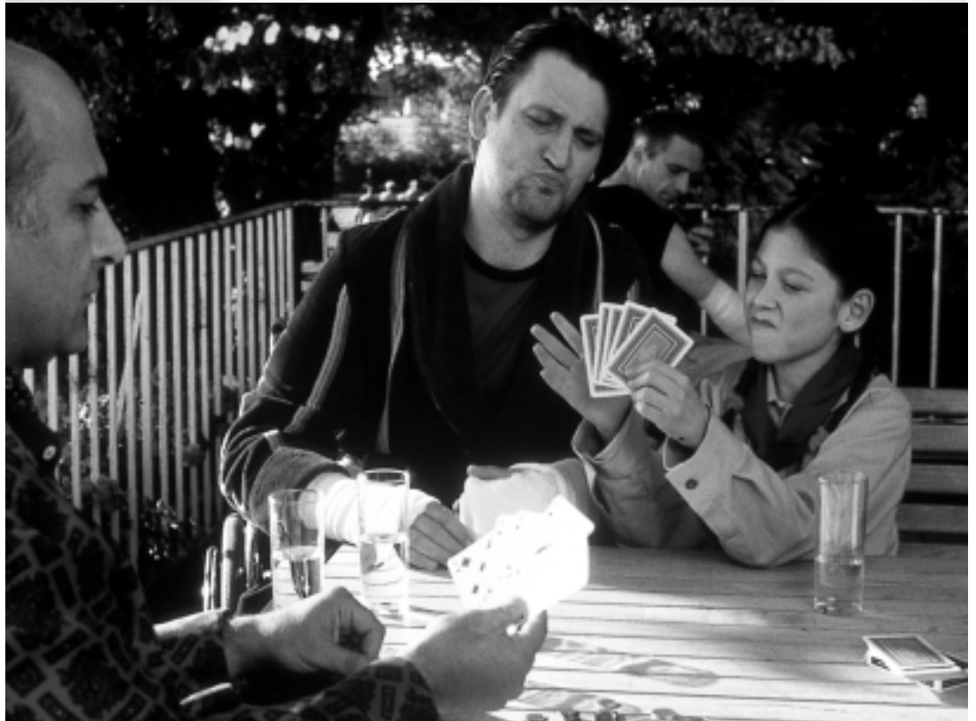
Mau-Mau mit Pokerface